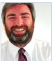
Andreas Golgath Interwoven GmbH

Enterprise Marketing Management: Das zentrale Marketing-Cockpit zur besseren Planung, Umsetzung und Steuerung von Marketingmassnahmen (2,6 MB)