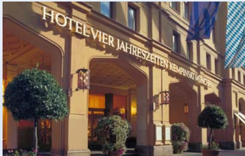
Hotel Vier Jahreszeiten Kempinski München