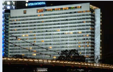
Hotel Intercontinental Frankfurt