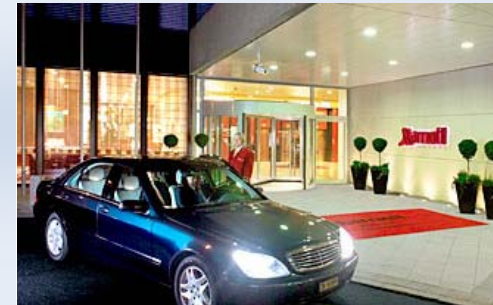
Hotel Marriott Zürich