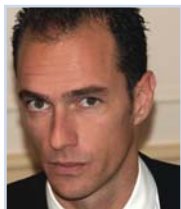
Christian Kleiner marketinghub AG

DOWNLOAD * Referate des 14. MAMFORUM | 06.11.2007 München